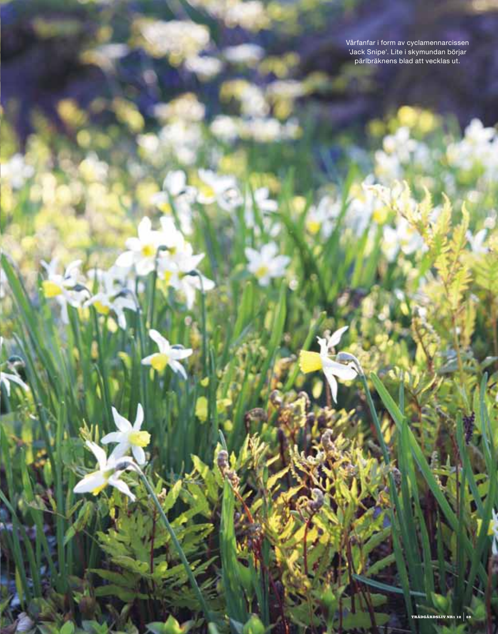
Vårfanfar i form av cyclamennarcissen 'Jack Snipe'. Lite i skymundan börjar pärlbråknens blad att vecklas ut.