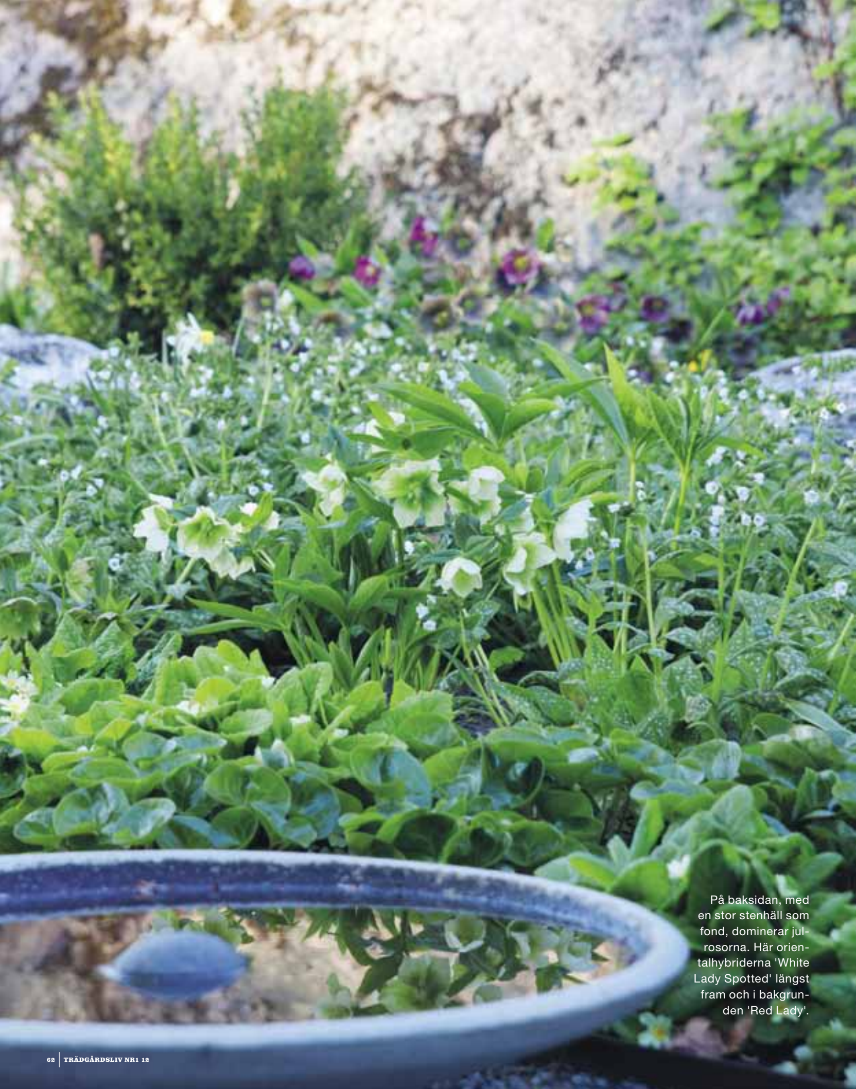
På baksidan, med en stor stenhäll som fond, dominerar julrosorna. Här orientalhybriderna 'White Lady Spotted' längst fram och i bakgrunden 'Red Lady'.