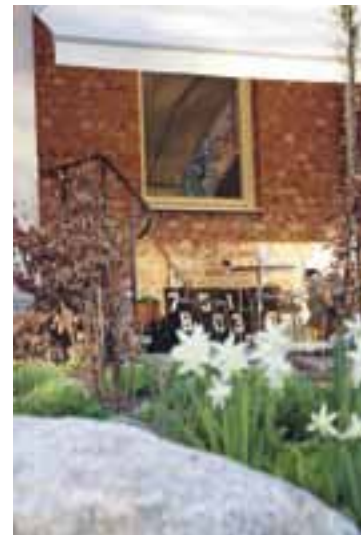
Uteplatsen vid entrén.