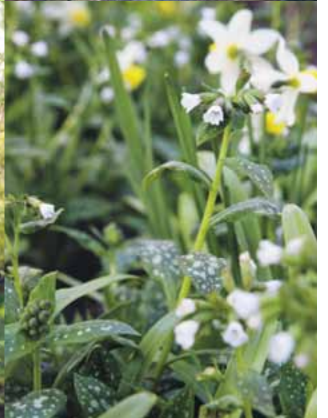
Överst t v: Jordvivan hör verkligen till det klassiskt engelska. Överst t h: Mitt i gruset står en majestätisk tall som fått sällskap av en klätterhortensia. Ovan t v: En spaljé av massiv järnstång skapar som ett fönster ovan bokhäcken. Ovan t h: Lungört 'Sissinghurst White' med sina vitfläckiga blad bildar en skir grund i rabatten på baksidan.