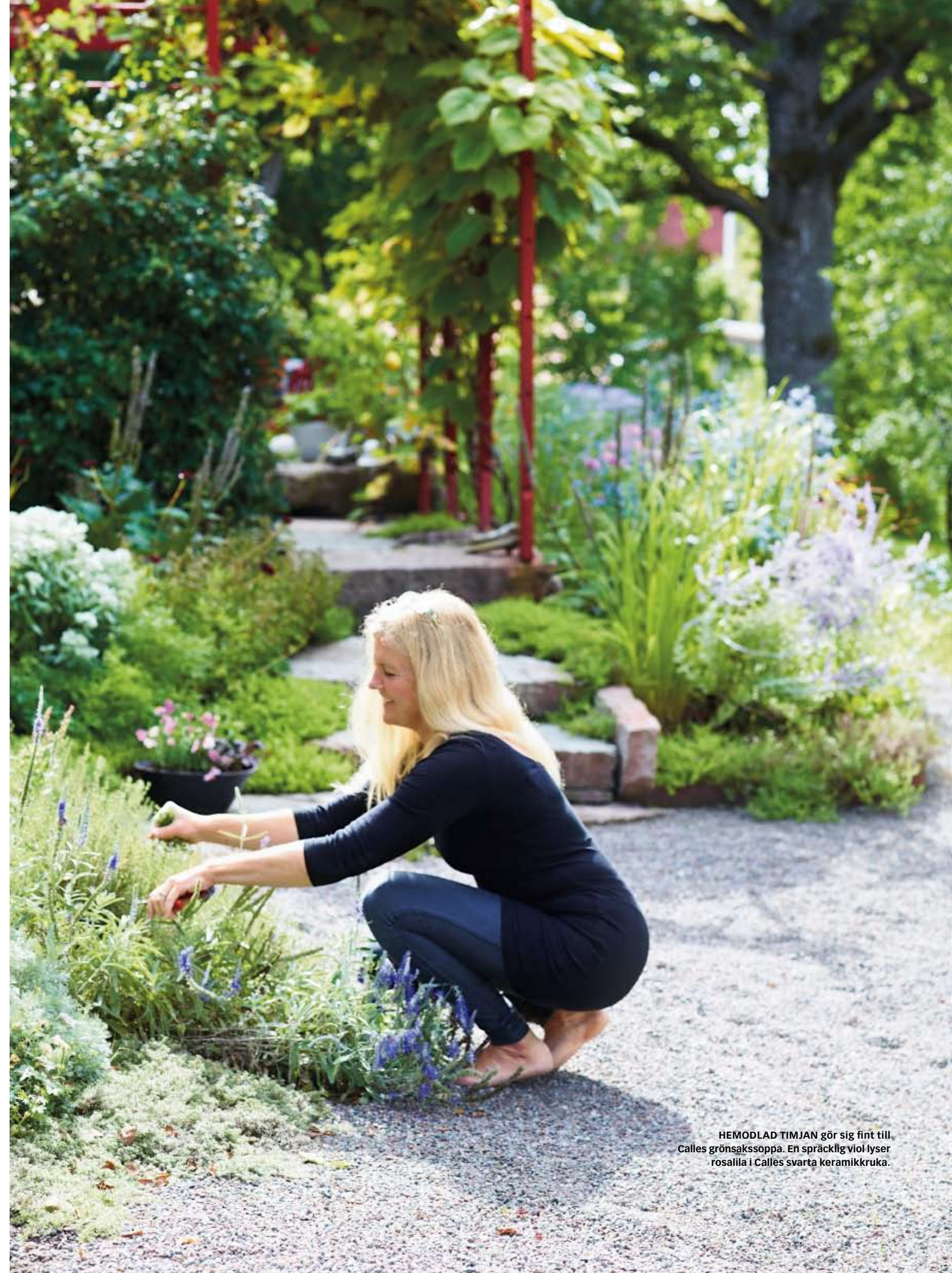
HEMODLAD TIMJAN gör sig fint till Calles grönsakssoppa. En spräcklig viol lyser rosalila i Calles svarta keramikkruka.