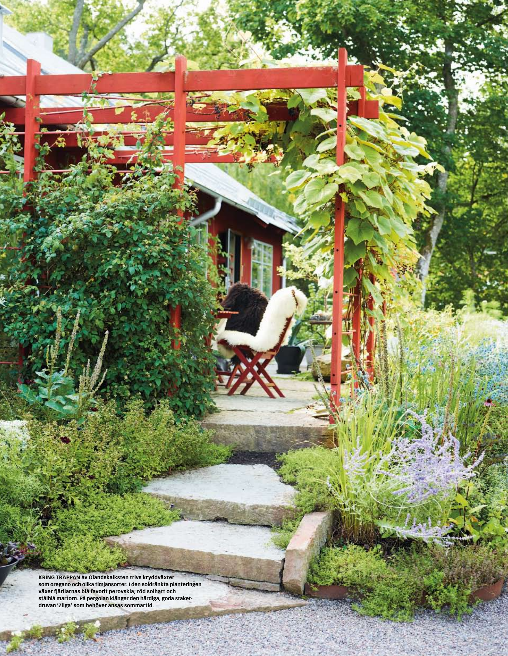
KRING TRAPPAN av Ölandskalksten trivs kryddväxter som oregano och olika timjansorter. I den soldränkta planteringen växer fjärilarnas blå favorit perovskia, röd solhatt och stålblå martorn. På pergolan klänger den härdiga, goda staketdruvan 'Zilga' som behöver ansas sommartid.