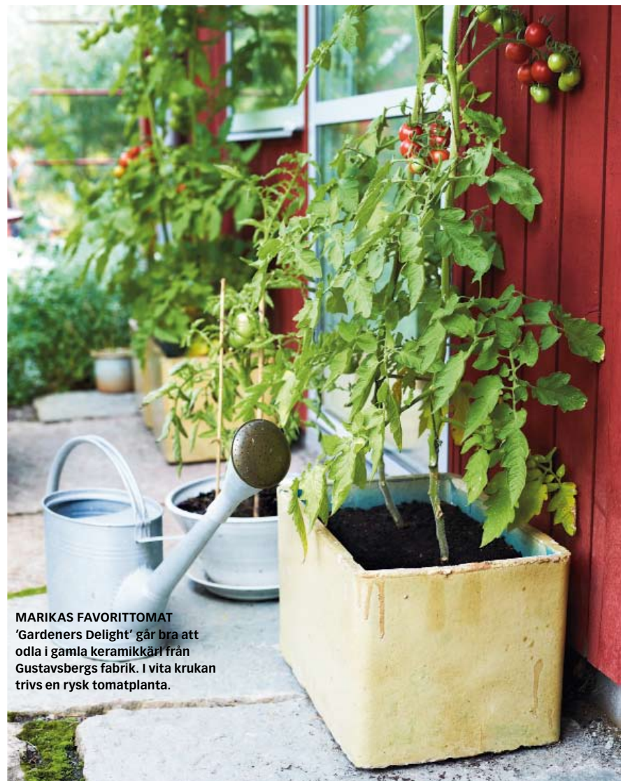
MARKAS FAVORIT TOMAT 'Gardeners Delight' går bra att odla i gamla keramikkar från Gustavsbergs fabriik. I vita krukorna trivs en rysk tomatplanta.