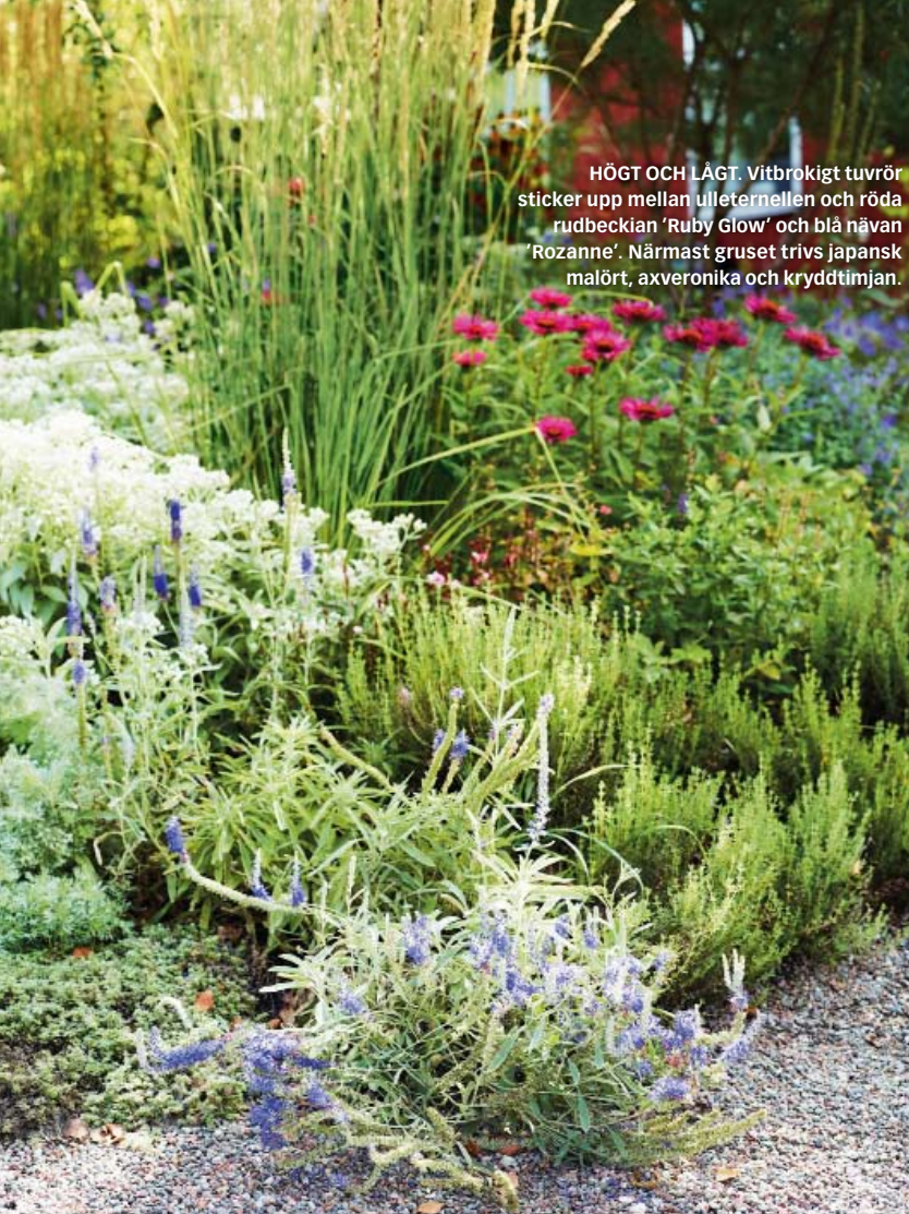
HÖGT OCH LÅGT. Vitbrokigt tuvrör sticker upp mellan ulleternellen och röda rudbeckian 'Ruby Glow' och blå nävan 'Rozanne'. Närmast gruset trivs japansk malört, axveronika och kryddtimjan.