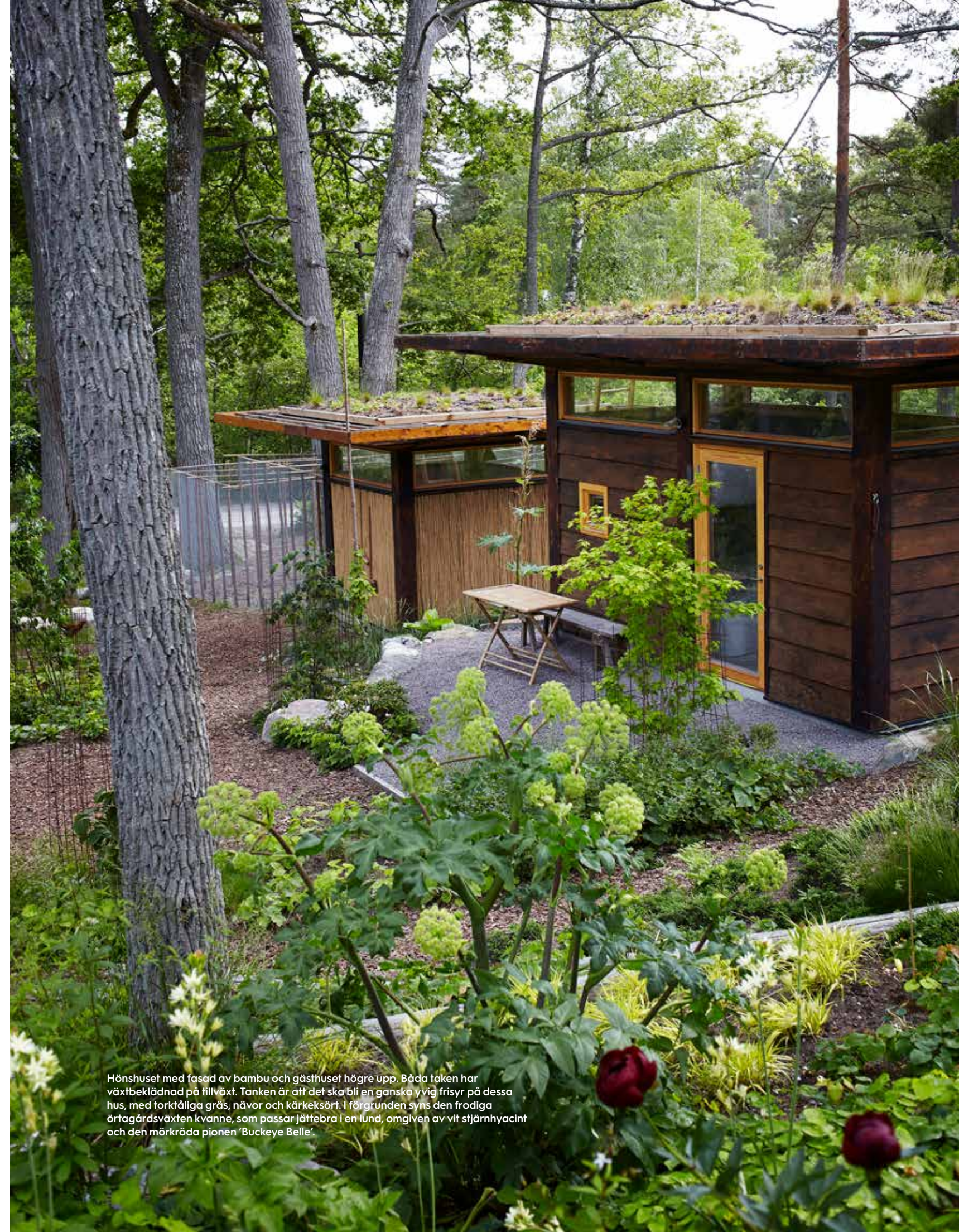
Hönshuset med fasad av bambu och gästhuset högre upp. Båda taken har växtbeklädning på fillväxt. Tanken är att det ska bli en ganska yvig frisyra på dessa hus, med torktåliga gräs, nävor och kärleksört. I förgrunden syns den frodiga örtagårdsväxten kvanne, som passar jättebra i en lund, omgiven av vit stjärnhyacint och den mörkröda pionen 'Buckeye Belle'.