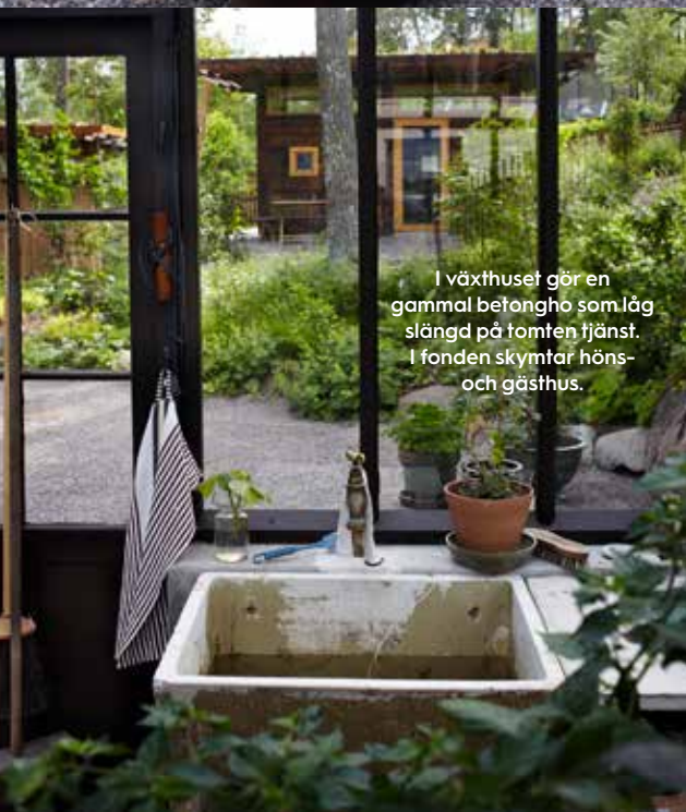
I växthuset gör en gammal betongho som låg slängd på tomten tjänst. I fonden skymtar höns- och gästhus.