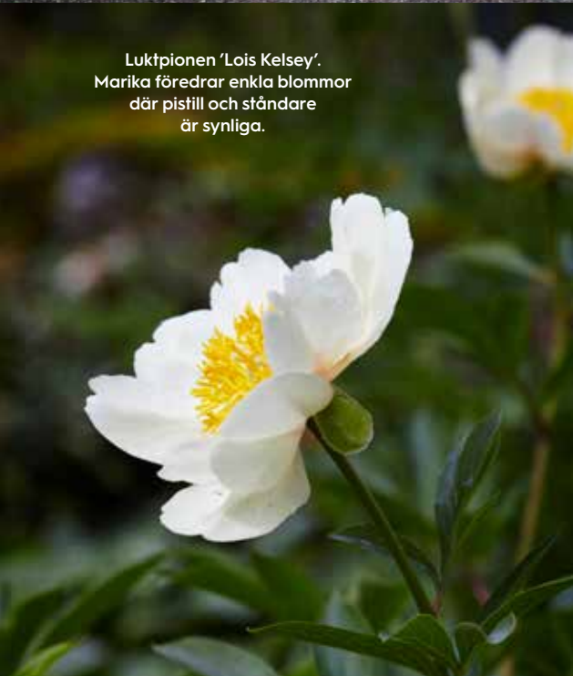
Luktpeonien 'Lois Kelsey'. Marika föredrar enkla blommor där pistill och ståndare är synliga.